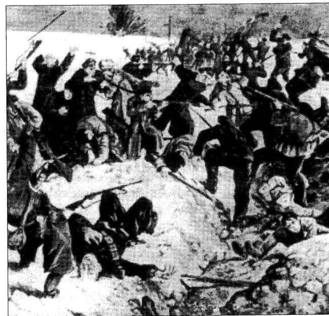
Бій під Крутами

росні січовий курінь уже не міг. Бракувало людей, набоїв, була відсутня належна координація дій. Але бій ще тривав до пізнього вечора. Тоді полягли майже всі. Уночі, уже після бою, у ворожий полон випадково потрапило 35 студентів та гімназистів, які брели розкислим полем без набоїв у рушницях. Сімох юнаків, серед яких були поранені, з невідомих причин большевики відправили до Харкова, що і зберегло цим крутянцям життя. А 28, що залишилися, зазнали страшних тортур. Цілу ніч знущалися над юнаками большевицькі головорізи. Навіть маленькі жиденята, яких було багато серед червоних, підскакували аби вдарити каменюкою в обличчя котрогось із хлопців.