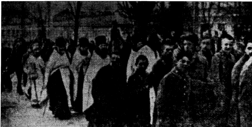
Похорон героїв Крут

ківським бульваром до Володимирської, де біля будинку педагогічного музею з тимчасовою спеціально збудованою трибуною Головою Центральної Ради, професором Михайлом Грушевським, багатьма урядовцями та громадськими діячами були виголошені жалобні промови. Далі процесія Фундуклеївською спустилася на Хрещатик і попрямувала центральною вулицею міста до Царської площі, а потім вздовж Царського саду Олександрівською вулицею піднялася вгору на Печерські Липки і поміж будівлями зрадницько-повсталого у січні 1918 року Арсеналу через Микільський спуск дісталася цвинтаря Аскольдової могили.