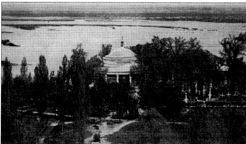
Цвинтар Аскольдової могили, де були поховані герої Крут

Зараз можна лише з болем у серці уявити всю загальну красу Аскольдової могили, враховуючи, що в надмогильних спорудах переважав білий колір мармуру й увесь простір біля пам'ятників в огорожах вистилася двоколірною плиткою. Майже кожен могилу прикрашала своєрідна комбінація з квітів та різноманітної зелені. Її складанням займався садівник кладовища, зі смаком добираючи рослини з оранжерій Аскольдової могили. Кожне поховання прикрашалось індивідуально й ніколи не повторювалося. Такого не було на жодному із кладовищ Києва.