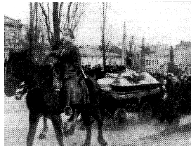
Похорон героїв Крут

19 березня 1918 року велелюдна сумна процесія киян від залізничного вокзалу попрямувала скорботною ходою Безаківською вулицею, Бібі-