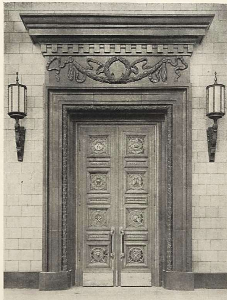
Портал с сандриком, выполненный из красного ленинградского гранита с зеркальной фактурой; фриз — из голубоватого лабрадора; накладные украшения — из бронзы. Обрамление и сандрик выполнены из массивных камней; приделаны облицовочные плитки. Нижняя часть сандрика составлена из трех рядов мелких деталей. Московский государственный университет. Центральный вход главного здания. Ленинские горы, Москва. Архитекторы: Л. В. Гудыча, С. Е. Червинский, П. В. Абрамцов, А. Ф. Храмов, 1933 г.