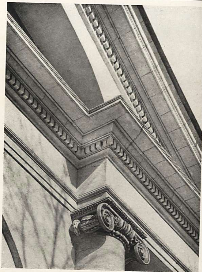
Карниз Фронтона, фриз и архитрав выполнены порядовой лицевой кладкой из плит мячковского известняка. Спускные плиты карниза заделаны в кладку на всю толщину стены. Голландская Большая Б. Калужская улицы, 8, Москва. Арх. М. Ф. Казаков, 1801 г.