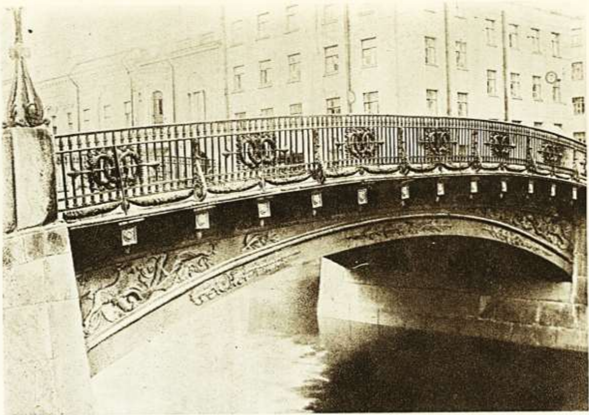
137. Неизвестный мастер (Гесте?). Перила Б. Копюшениного моста через р. Мойку. Ок. 1840 г.