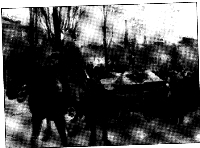
З української газети 1918 року