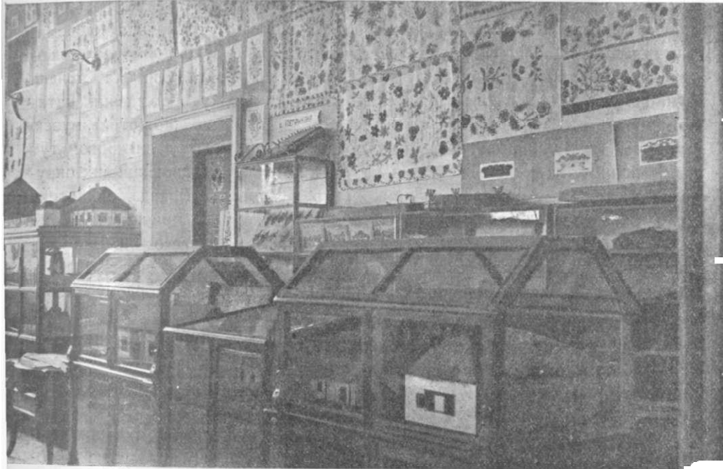
Частина виставки народного мистецтва (на стіні). Відділ соціально-побутовий.