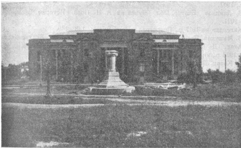
Недобудоване нове помешкання Краєвого музею.

8. Зв'язатися з культурниками сільської периферії, як от з учителям, комсомолом, сельбудами, хатами-читальнями, що найбільше допоможуть у збиранні та вивченні пам'яток музейного значіння.