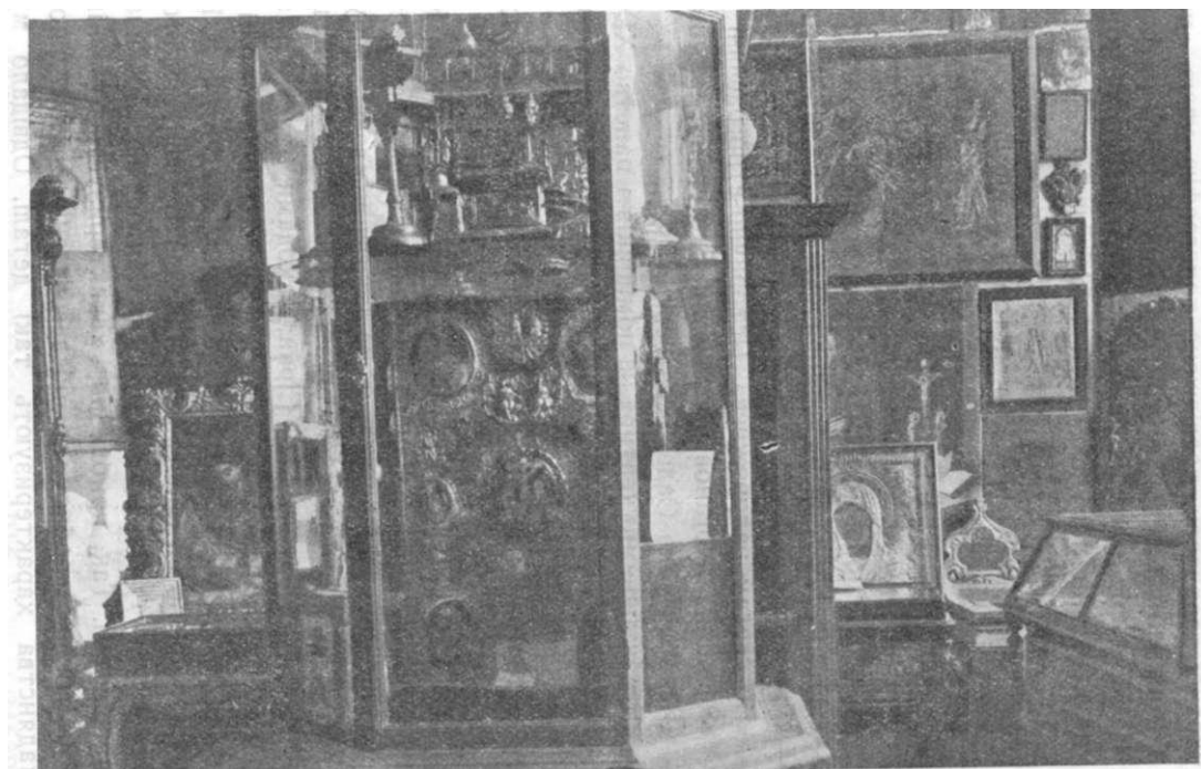
Колекції музею з відділу народніх культурів.