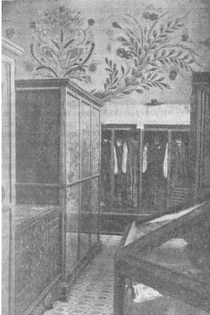
З відділу соціально-побутового.

ний історичний процес, з характерними для нього класовою боротьбою та соціальними рухами. Але треба зазначити, що не завжди такий метод в умовах роботи Дніпропетровського краєвого музею здійснюється, бо це знову таки зв'язано з приміщенням, з можливостями експозиції