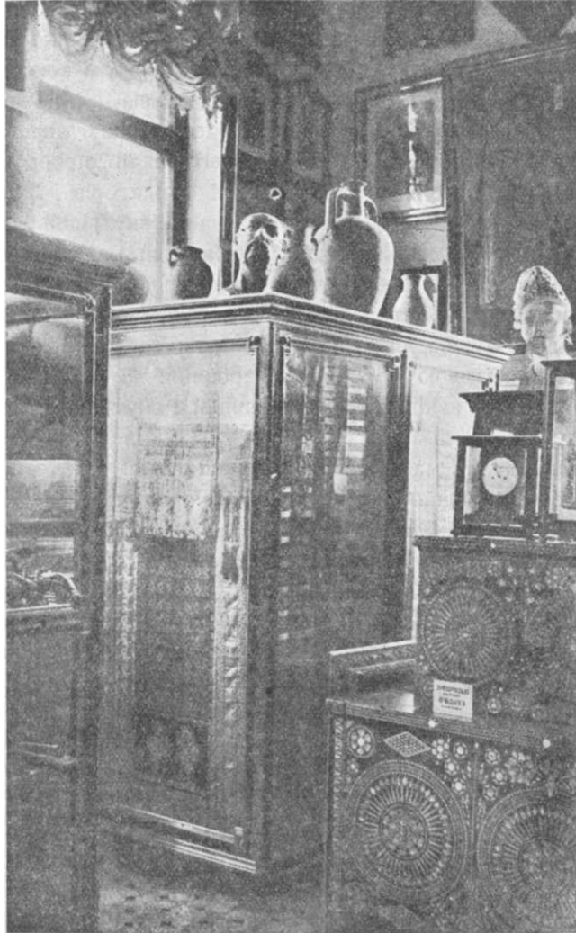
Колекції з запорізького відділу.

ручно писана автобіографія поета, і дуже багато фотографій ілюструють його життя 1) . Інтересні речі письменників: Тургенева, Гоголя й інш.; речі художників: Лампі (батька), Ріго, Анжело, Корнієнка, Класена, Струннікова й інш.