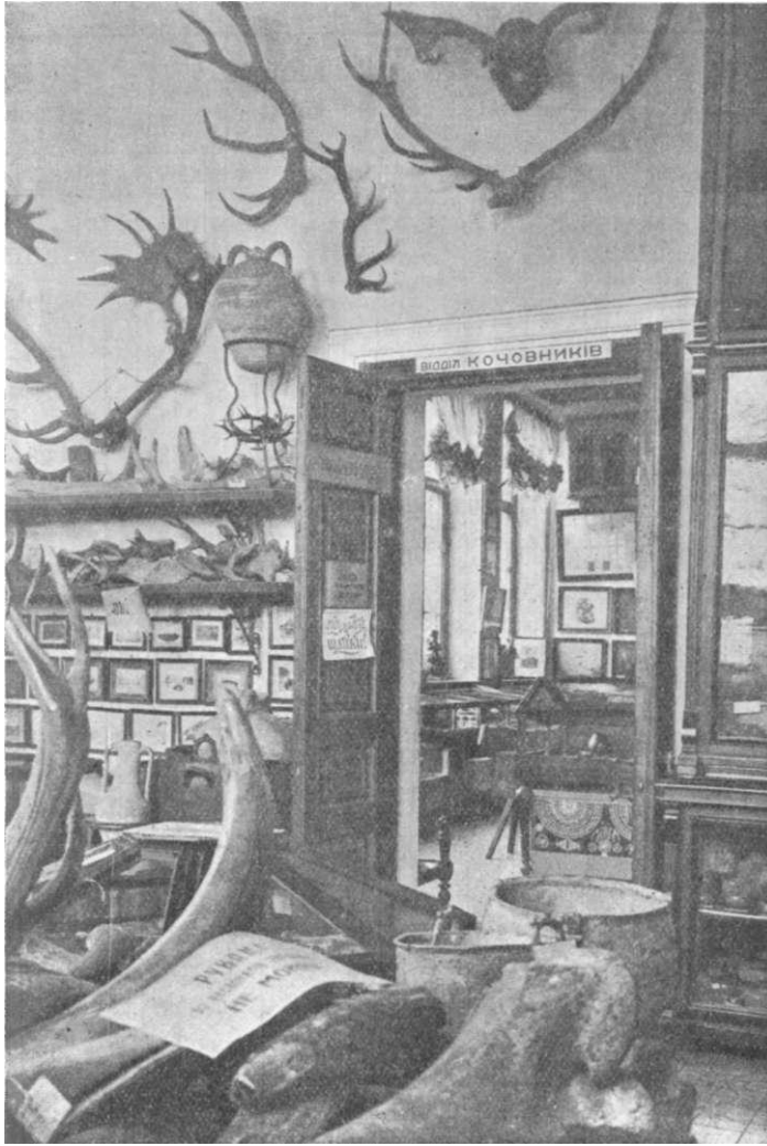
Частина відділу первісних культур.

до Єгипту добути такого плану, який би відповідав останнім зразкам музейної будівельної техніки й архітектурного стилю. З 1912 р. за планом Каїрського музею, розпочато будову, що продовжувалась до 1914 р.; помешкання було майже закінчене, але, в зв'язку з імперіялістичною війною