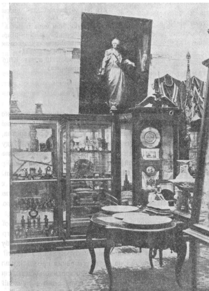
Західньо-європейська культура та мистецтво (частина відділу).