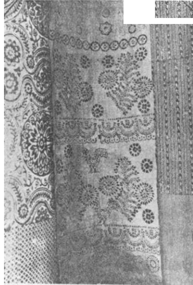
Вибійка полотна в с. Петриківці. Дніпропетр. окр.

3. Розгорнути широкі археологічні й етнографічні дослідження по Дніпропетровщині, Запоріжжю й Криворіжжю з метою дальшого вивчення й збирання пам'яток матеріальної культури селянства, а також, у зв'язку з подіями революційного десятиліття й Дніпрельстаном, простежити, оскільки позитивно відбилася на духовній та матеріальній культурі селянства Жовтнева революція; продовжувати вивчення народної художньої творчости;