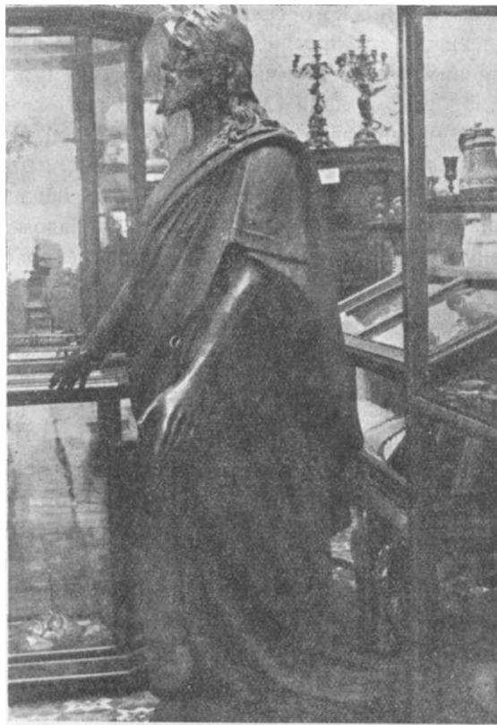
Бронзова статуя Христа роботи Опікушіна.

сила відвідувачів. Через тісноту у відвідувача вражіння складається take , що це не музей, а склад якоїсь старовини. І така думка, з одного боку, ніби й правдива. Та й система поділу матеріялу по всіх відділах, через надзвичайну тісноту, розуміється, втратила своє значіння, і її не гаразд видно; можна було б цьому запобігти хіба тим, щоб просто не виставляти речей, коли немає де, але музейними речами переповнений підвал, горище, всі скрині, навіть, у подвір'ї стоячи, мокне й псується