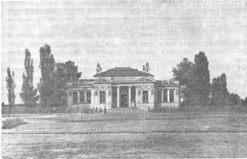
Загальний вигляд Краєвого музею в Дніпропетровському.

державців. Поля дуже часто не розуміли навіть у Петербурзі 1) . Потрібні були капітали. І от, за ініціативою Поля, організовується французька компанія для експлуатації криворізької руди, а слідом за нею—бельгійська та англійська, що раптово хапаються за будову залізо-обробних і металургійних заводів, виводячи, таким чином, металургійну й гірничу промисловість України в стан європейського капіталізму. Відкриті природні багатства півдня притягли сюди чужоземні капітали, які одразу дали почути себе в ростові промисловости, вивізній і внутрішній торгівлі краю. Неорганізо-