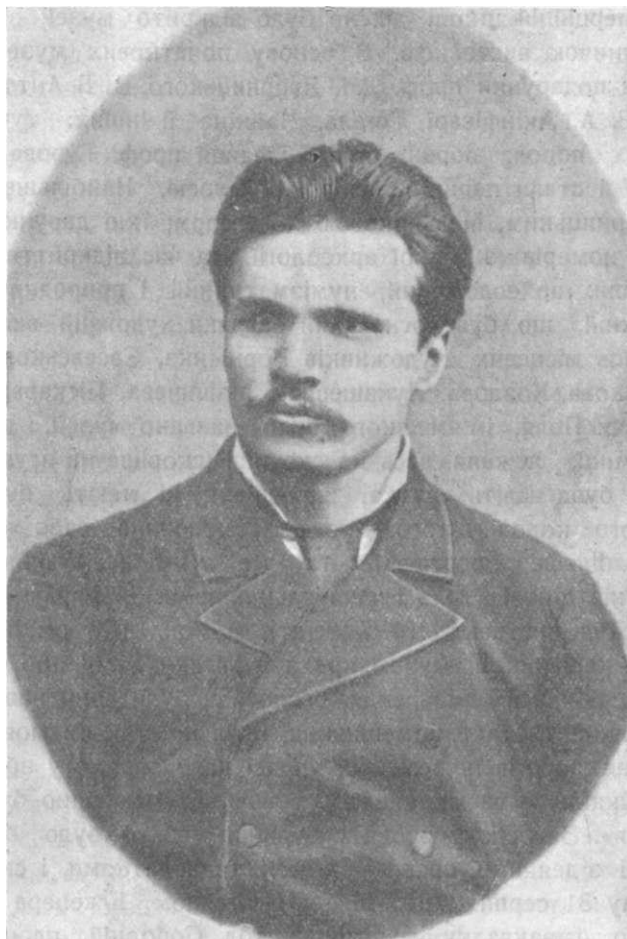
Замолоду проф. Дм. Іван. Яворницький — фундатор Краєвого музею.

1902 р. Губерніяльна земська управа, для організації і надання певного напрямку музейній роботі, запрохує професора Московського Університету Д. І. Яворницького, ім'я якого потім стало найбільше зв'язане з культурно-освітнім розвитком міста і дослідженням південного краю України взагалі. На нього й лягає обов'язок перевести всі підготовчі дослідницькі