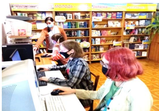
Бібліографічне навчання Аудіо книга – допомога у навчанні (жовтень, юнацький відділ ЦМБ)

Складовою частиною інформаційно-бібліографічної роботи бібліотеки залишалося формування і підвищення бібліотечно-бібліографічної грамотності користувачів. У першу чергу приділялась увага інформаційному вихованню молоді, учнів ПТУ та коледжів, особливо першокурсників. Загальне уявлення про бібліотеку, її структуру, особливості роботи, пошук інформації, каталоги і картотеки, в тому числі електронні, первокурсники набували під час екскурсій : «Дебютна зустріч з бібліотекою» (січень, ЮВ ЦМБ); «Книга – ключ до знань» (березень Ф 1); «Бібліотека – книжчин дім і нам усім цікаво в ній» (вересень, Ф2); «Читання – світу нашого пізнання» (грудень, Ф 3); ерудит – турніру «Чит@ю – про все знаю» (березень, Ф 4); години цікавої бібліографії «Про книгу та бібліотеку» (квітень, ЦДБ); на святі книголюба «Бібліотека – чудо, бібліотека – клас, вона завжди чекає вас» (вересень, Ф 4); бібліогрі «Енциклопедії та словники – у навчанні помічники» (вересень, Ф 4); «Життя радісним стає, якщо книга другом є» (вересень, ЦДБ); бібліогостини «Книги шукають друзів» (листопад, Ф 2); святі книголюба «Книги читаємо – розуму черпаємо» (вересень, Ф 4); бібліотечних заняттях «Мистецтво бути читачем» (лютий, ЦДБ); «Книга: подорож у часі» (вересень, ЦДБ) та на інших заходах.