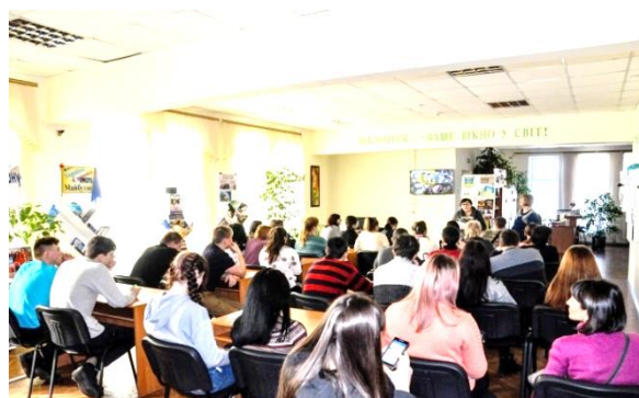
Година-реквієм «Небесна сотня воїнів святих»