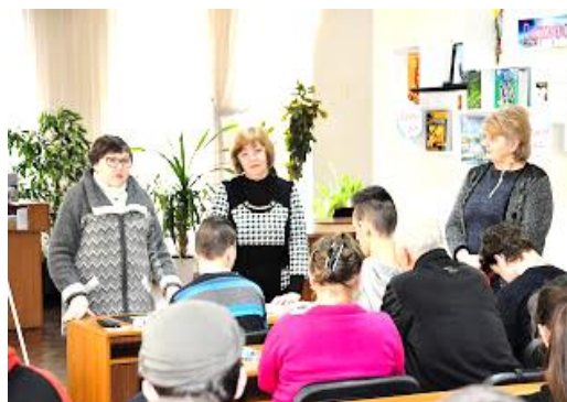
Калейдоскоп неймовірних «Любов придумана не нами»

Краєзнавство – цей напрямок роботи наших бібліотек протягом 2020 року, не втрачав актуальності серед наших користувачів. В читальному залі ЦБ оформлено розгорнуту постійно діючу інформаційну виставку «Новомосковськ – земля гостинності й добра», де представлено рубрики: «Відкрий для себе рідне місто», «Нашої історії рядки», «Торкаючись душею до краси», «Герої сьогодення», «Інформаційний компас», «Маршрутами рідного міста», яка постійно оновлювалась і поповнювалась новими матеріалами.