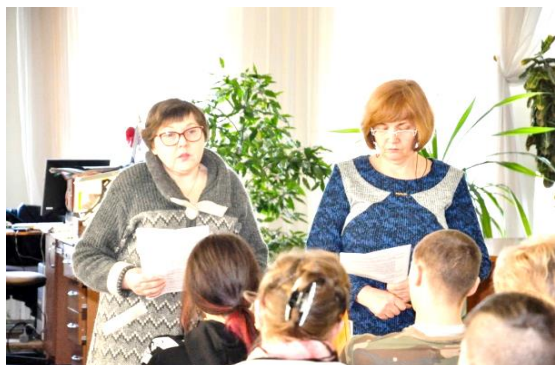
Мовознавчий акорд «У ріднім слові цілий світ» цікавинок