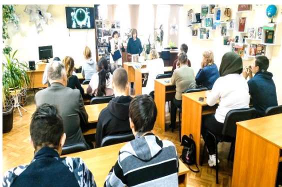
Історичне досьє «Україна, твоя доля – єдність, злагоди а і воля»

Проводили години інформації : «Дитячі книги - просто клас, завітай скоріш до нас» (січень, ЦДБ); «Новинки – поспішайте прочитати» (лютий, Ф № 1); «Щоб всі діти більше знали є газети і журнали» (березень, Ф № 2); «Чорнобиль! Його забути не дозволяє майбутнє» (квітень, Ф № 3); «Мова – це музика душі, покладена на слова» (листопад, Ф №1); огляди літератури : «Гортаючи старі журнали» (лютий, Ф № 2); «Тонке мереживо жіночої душі» (березень, юнацький відділ ЦМБ); «Мирослав Дочинець: світло його книг» (вересень, Ф № 2); «Самоцвіти землі української» (грудень, юнацький відділ ЦМБ); книгозаправку «Прочитайте залюбки, ось вам новенькі книжки» (березень, Ф № 4); мандрівку сторінками історичних творів «Подорож козацькими шляхами» (жовтень, Ф № 4); інформаційні коктейлі «Прочитай – не пожалкуєш» (жовтень, Ф № 3); «Наша преса від нудьги і стресу» (грудень, Ф № 4) та інші.